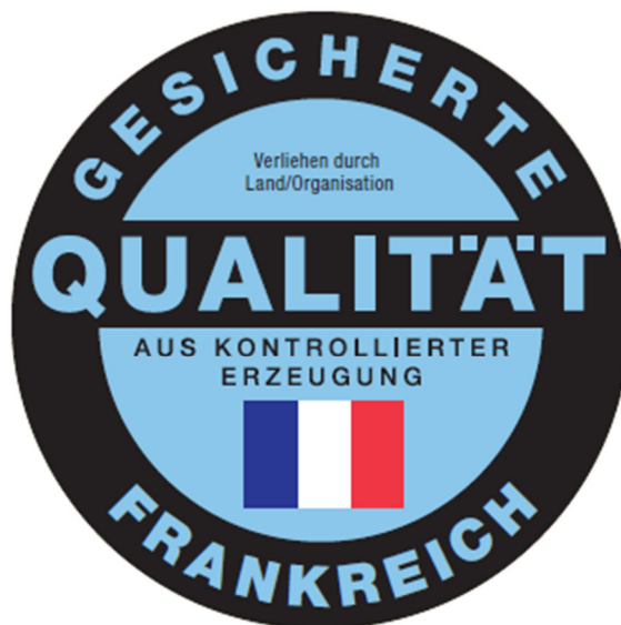
Qualitätszeichen am Beispiel Frankreich

Das Zeichen ist in schwarzer Farbe auf blauem Grund (Pantone 2905) abgebildet. Eine Verwendung des Zeichens in anderer Farbgebung ist in Abstimmung mit dem MLR möglich.