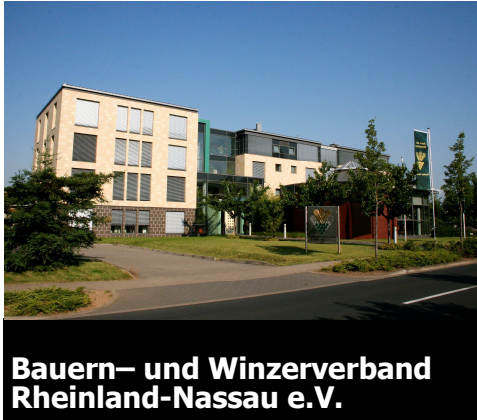
Bauern- und Winzerverband Rheinland-Nassau e.V.